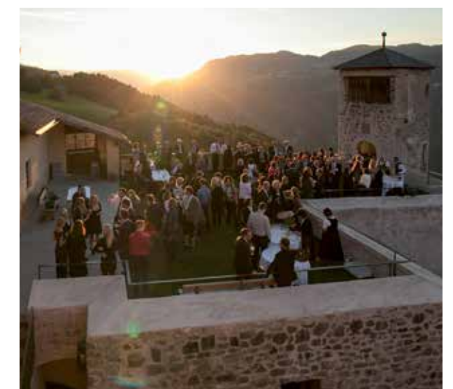
Feier zum 30-jährigen Jubiläum der KPWT-Gruppe

kunftsorientierter Beratung zur Seite, um die ökonomischen, rechtlichen und steuerlichen Rahmenbedingungen optimal auszuschöpfen. Gebündeltes Spezialwissen auf dem neuesten Stand kommt unseren Mandanten auf kurzen Kommunikationswegen zugute. Dabei wird gerade die interdisziplinäre Teamarbeit aktiv und ständig gelebt. Dazu gehören aktives Mitgestalten, Ideen einbringen, Entscheidungen positiv beeinflussen und mittragen. Wir möchten, dass Sie für Ihre Zukunft gewappnet sind!