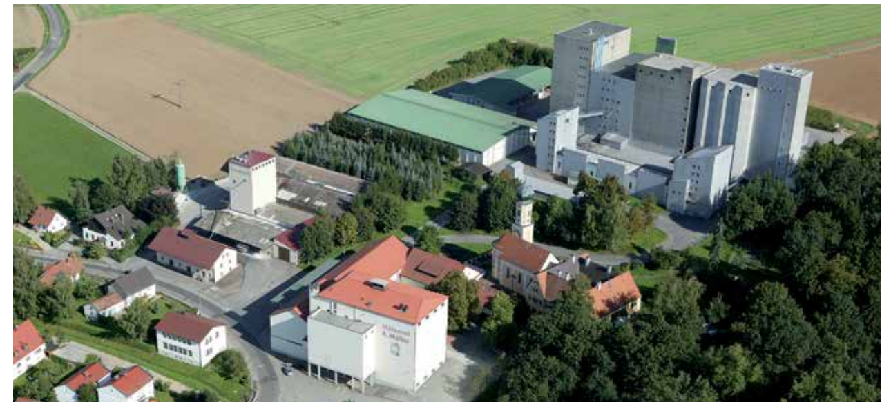
Luftaufnahme der Malzfabrik Müller, Inkofen/ Oberpfalz

Rund 25 Mitarbeiter, die alle aus der näheren Region stammen, beschäftigt die Mälzerei Müller. Viele Mitarbeiter können auf eine lange Betriebszugehörigkeit verweisen. „Unser Betrieb lebt vom unheimlich großen Engagement unse-