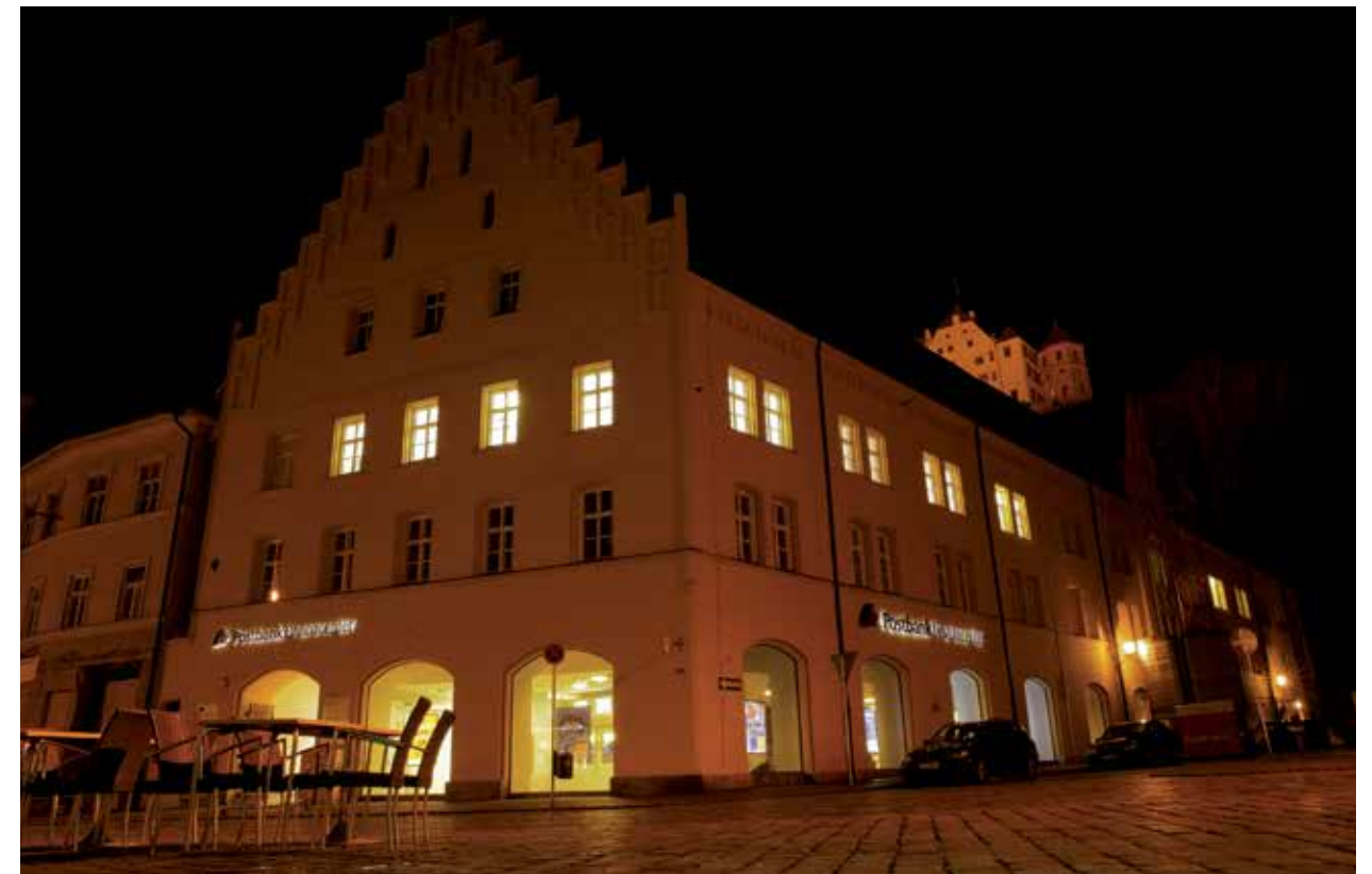
Die neu eröffnete Kanzlei im historischen Gebäude „Herzogkasten“ im Herzen der Landshuter Altstadt

Die KPWT-Landshut und die KK&P belegen mit 27 Mitarbeitern den gesamten 2. Stock. Die Konzentration auf einer Etage sichert kurze Kommunikationswege und konzentrierte Arbeitsabläufe zum Nutzen der Mandanten.