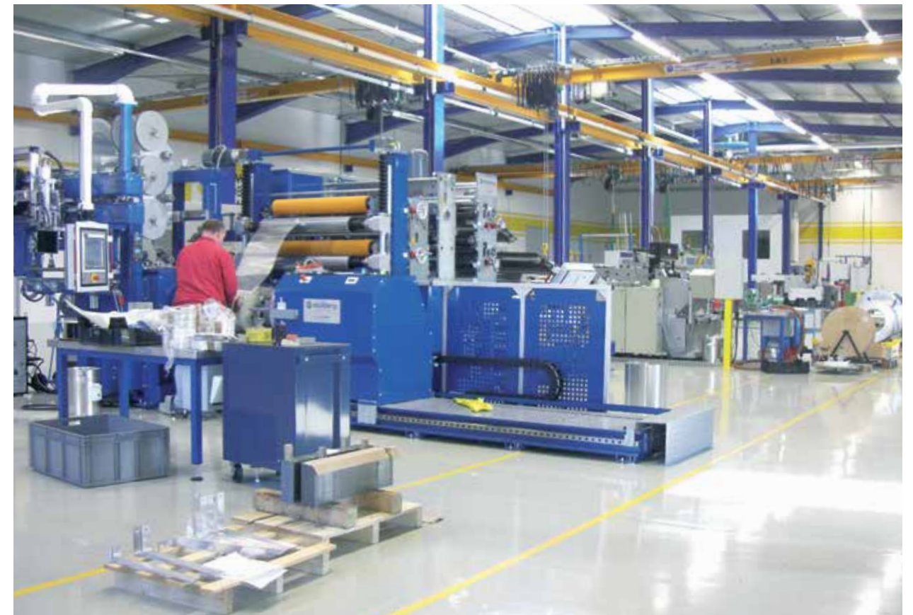
Qualifizierte Mitarbeiter, strukturierte Betriebsabläufe, moderne Fertigungsanlagen am Standort Hebertsfelden

formatoren und Drosseln helfen den Kunden, im späteren Betrieb Energie zu sparen. Für rückspeisende Technologien, beispielsweise bei Blockheizkraftwerken, Antriebssystemen oder Solaranlagen, müssen bei der Einspeisung – und damit bei den Bauteilen – enge Toleranzen und hohe Wirkungsgrade eingehalten werden. Im Bereich der Steuerungen können wir den Kunden Komplettlösungen anbieten. Innerhalb der Unternehmensgruppe werden durch die Schmidbauer Blechbearbeitung und die Ergatec Elektronik komplette Systeme angeboten. Beide Unternehmen befinden sich ebenfalls am Standort in Hebertsfelden. Ein großer Vorteil besteht darin, so die Geschäftsführer Heinrich Schmidbauer und Dominik Reichl, dass die Entwicklungsbereiche auf kurzem Wege innerhalb des Engineerings zusammenarbeiten. Dadurch